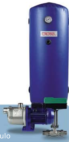
Pompe Valvole Serbatoi di accumulo