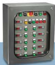
Quadri elettrici personalizzati. Termometri e termostati