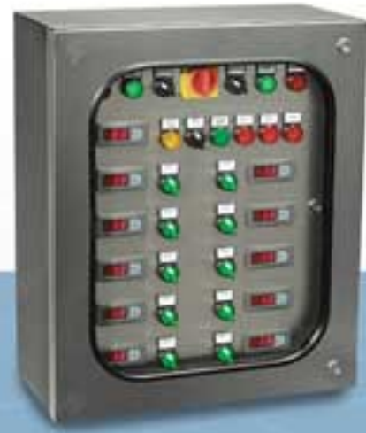
Quadri elettrici personalizzati. Termometri e termostati