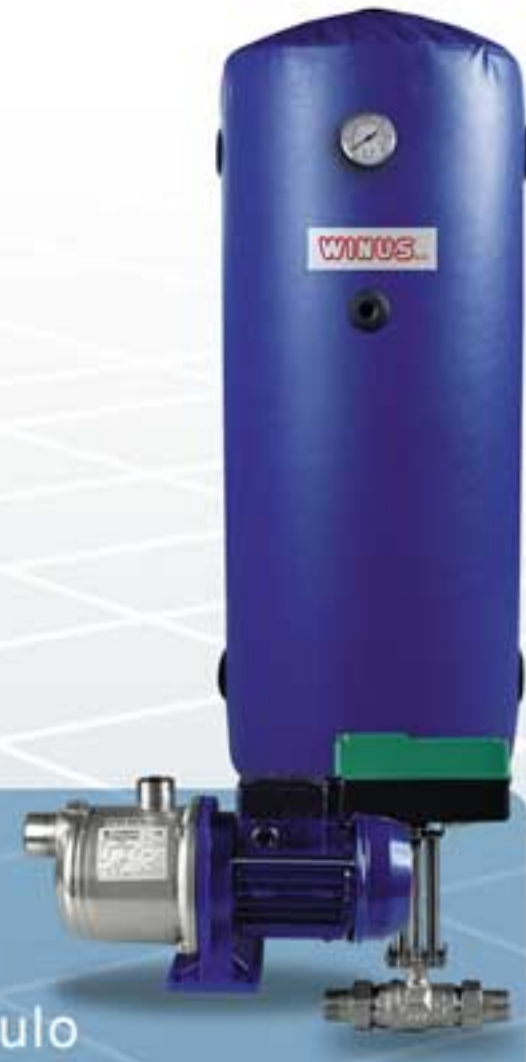
Pompe Valvole Serbatoi di accumulo